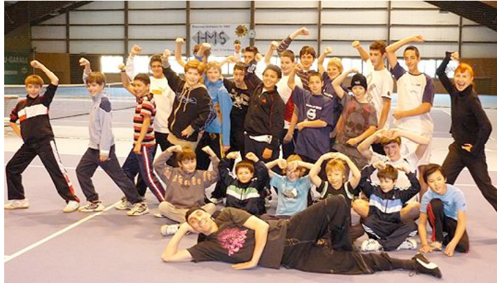
Gut gelaunt und ausgetobt: Die Teilnehmer und ihre Tanzlehrer nach der Hip-Hop-Stunde.

Der SEV-Wettbewerb Men on Ice 2010 fand am 3. Januar in der Eishalle Oberwynental in Reinach/AG statt. Mit 29 teilnehmenden Knaben war der Anlass sehr gut besucht. Im Anschluss an die Wettkämpfe in den Kategorien BS ohne Test, BS Interbronze, BS Bronze, BS Intersilber, SEV-Jugend und SEV-Nachwuchs fand noch ein Hip-Hop-Tanzkurs für die „Jungs“ statt.