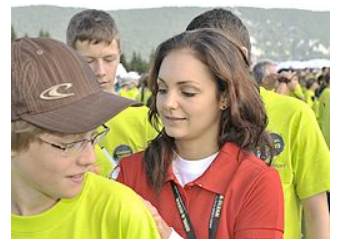
Sarah Meier umringt von Autogrammjägers

Rund 1000 Jugendliche aus der ganzen Schweiz trafen sich am Samstag, 28. August auf dem Sportgelände «End der Welt» in Magglingen/BE zu den «cool and clean»-Games. Der Anlass bot den Teilnehmenden einen bunten Mix aus Sport, Spass, Präventionsarbeit und natürlich die Nähe zu Schweizer Sportstars. Die 17 anwesenden Topathleten, darunter befanden sich Sarah Meier sowie der Radrennbahnfahrer Franco Marvulli , zeigten keinerlei Berührungsängste mit den Jugendlichen.